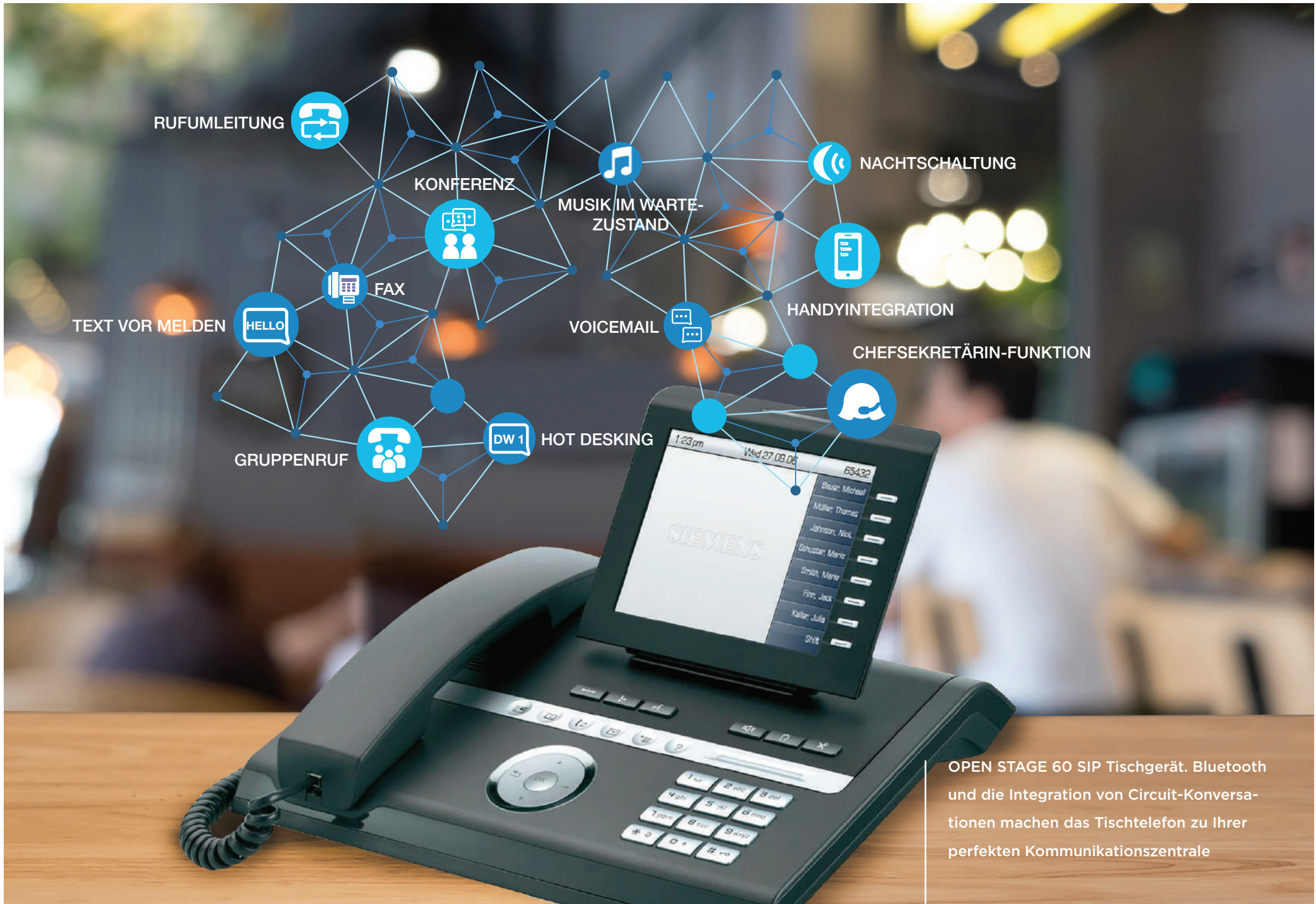
OPEN STAGE 60 SIP Tischgerät. Bluetooth und die Integration von Circuit-Konversationen machen das Tischtelefon zu Ihrer perfekten Kommunikationszentrale